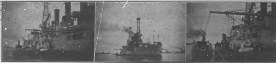
En Cuanánamo.—Buques de la escuadra americana en la Estación Naval.

al trabajo la tenemos en el desarrollo que obtienen ciertas industrias en Cuba.