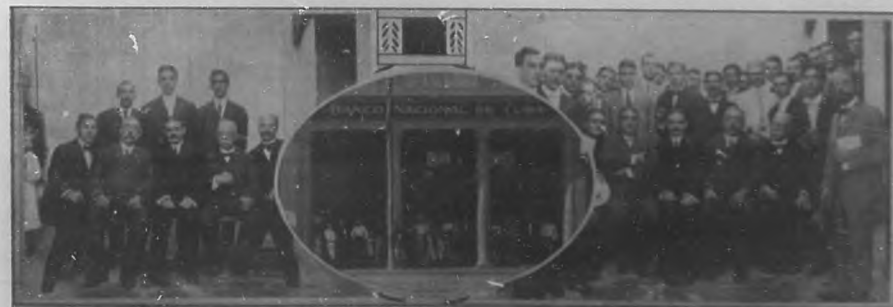
Banco Nacional.—Inauguración de la Sucursal de Jesús del Monte.

Prueba de lo que puede la fuerza de voluntad y el amor