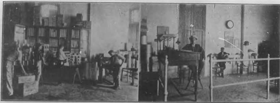
Fábrica de dulces "La Nación".—Vistas del escritorio y del departamento de envasas.