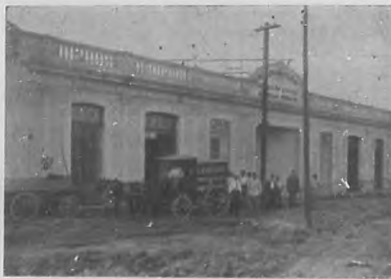
Fábrica "La Nación".—Vista exterior del edificio.