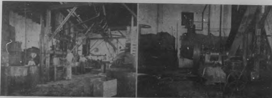
Fábrica de dulces "La Nación".—Maquinaria y parte de los talleres.

Como consecuencia del ridículo asunto del cange de los terrenos del Arsenal por los de Villanueva cuenta la Habana con una magnífica estación, indudablemente una de las más bellas y espaciaosas de la América latina.