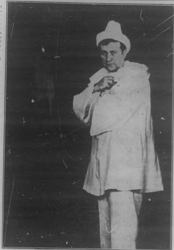
El célebre tenor español Constantino en "I Pagliaci"

Y no hay parameños. Hasta ahora habíamos tenido como base de la compañía, como nombre de inmejorable cartel, el de una tiple ligera: Graziella Pareto. Ahora á este nombre se une el de un famoso tenor: Constantino. Y éste es de tan envidiable condición, que lo mismo cantará con la Pareto óperas como "Lucía", que otras para tenor dramático escritas. Así pues, junto á las noches en que la pareja citada cante, tendremos otras con el cuadro dramático en el cual hay hay tan buenos elementos como Federici, la Galán y la Adalberto. Buenas veladas se promete el público que,