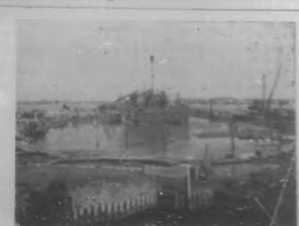
Estado actual de la ataguía