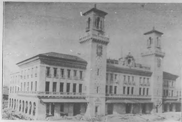
Estado actual de la nueva estación ferroviaria del Arsenal, vista de frente.

Señores del estudio rendir hoy testimonio de cariñoso afecto á un grupo de adalides de la más santa causa: el grupo de maestras y maestros que en San Luis hacen que fructifique vigorosa la semilla que esparcen en jóvenes inteligencias. Figuran en él el Presidente de la Junta de Educación y otros miembros de la misma. A todos llegue el saludo de BOHEMIA y el aplauso de quienes siguen con interés el proceso educativo del pueblo.