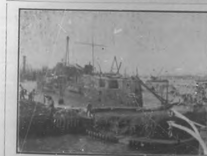
"El Maine" visto de costado