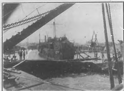
El "Maine" a flote.

Habiéndose ocupado de él la prensa toda, BOHEMIA se limita a publicar una información gráfica y se complace en adherirse nuevamente al acto afectuoso en honor de un compañero distinguido, ineludador incansable.